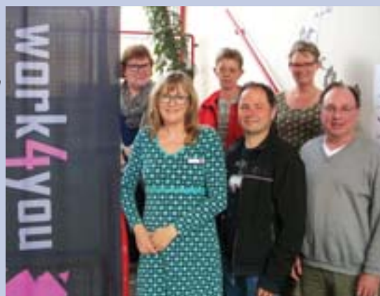
Tilfredse kursister og undervisere